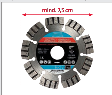
Beispiel Produktbild BGW-Katalog